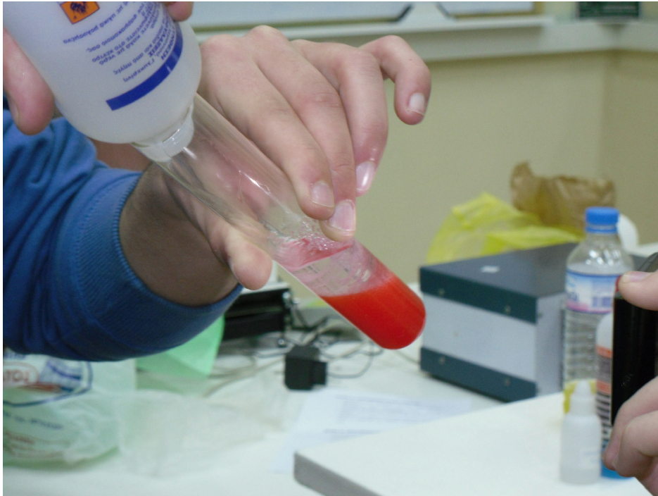
Εικόνα 4. Προσθήκη αλκοόλης.