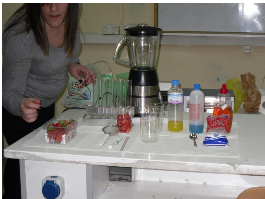
Εικόνα 1. Οι φράουλες έτοιμες για ομογενοποίηση. Διακρίνονται οι δοκιμαστικοί σωλήνες, τα ποτήρια ζέσεως, ο ομογενοποιητής, ο χυμός του ανανά (κίτρινος), το μπλε οινόπνευμα, το υγρό πιάτων και το μαγειρικό αλάτι.