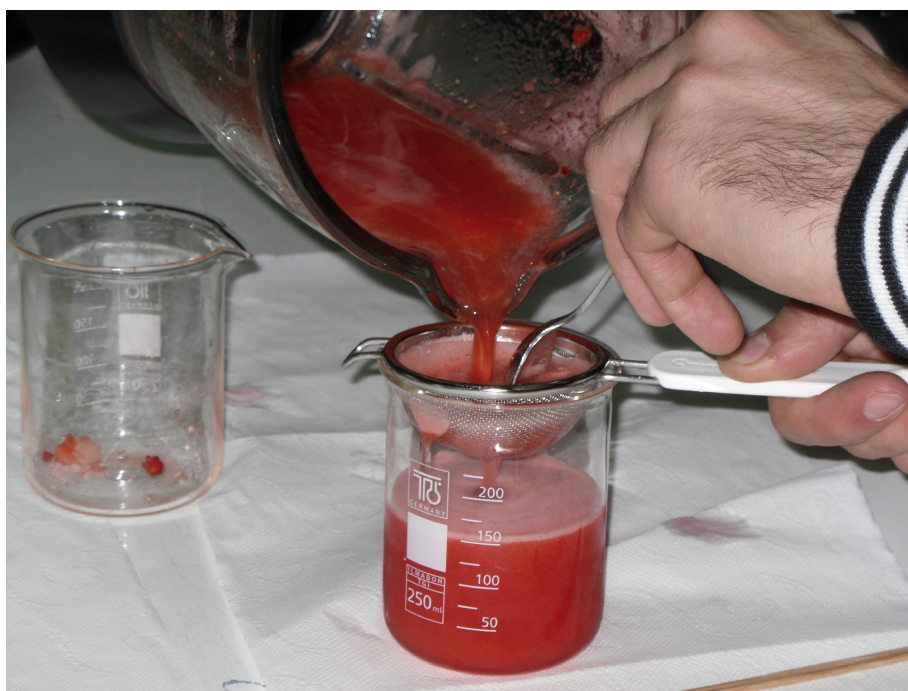
Εικόνα 2. Η «φραουλόσουπα» σουρώνεται...